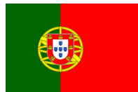
Флагът на Португалия с армиларна сфера