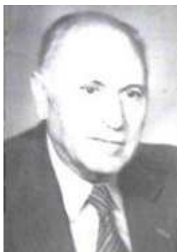
Проф. Стоян Петров

Поради липса на оборудване и дублиране с Държавната политехника в София, през 1948 г. е взето решение да се закрие Висшето техническо училище в Русе и студентите са изместени да продължат образованието си в Държавната политехника в София. След закриването на Висшето техническо училище Руска Драгнева посвещава на обучението и възпитанието на младото поколение Русе повече от 50 години от своя живот. Създава първата в страната специализирана школа по физика за изявени ученици (1970). Няколко десетки нейни възпитаници – тридесет и пет – се класират на подборните кръгове на Републиканската олимпиада по физика, а седемнадесет от тях вземат участие в международни олимпиади в Лондон, Москва, Хелзинки и др.