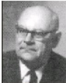
Проф. Разум Андрейчин