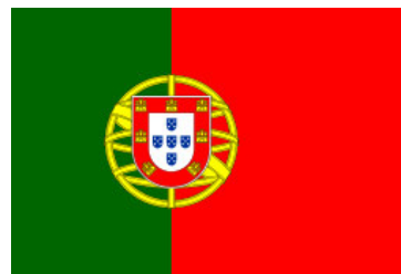
Флагът на Португалия с армиларна сфера